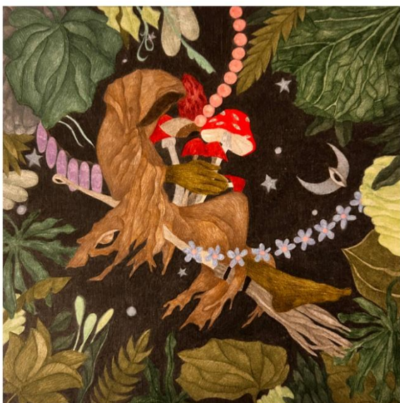
Marie Lukáčová Baba jaga a její děti (2026) tužka na papíře 20 x 20 cm