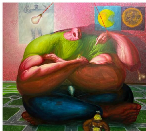
Samuel Kollárik Kiddo (2026) akryl a olej na plátně 180 x 200 cm